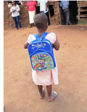
Bereit für die Schule!

Eine Patenschaft beginnt im Kindergartenalter und begleitet das Kind auf seinem Bildungsweg. Dieser streckt sich über 3 Jahre Kindergarten, 8 Jahre Grundschule und 4 Jahre Oberschule. Die Einschulung erfolgt in der Regel in der Oasis Academy oder der Renate Schule in Mamba Village. Dieser Ort liegt im ländlichen Gebiet des Kwale Distrikts, ca. 2,5 Autostunden südlich von Mombasa und nahe der Grenze nach Tansania.