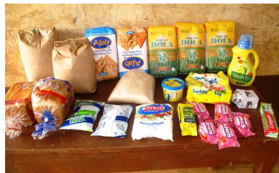
Lebensmittel für € 40,00

Die Fahrten in die Projekte nutzen wir deshalb immer, um die Fahrzeuge mit Lebensmittelpaketen auszulasten. Ein Lebensmittelpaket kostet € 40,00 und beinhaltet u.a. Zucker, Maismehl, Weizenmehl, Bohnen, Reis, Milch, Brot, Tee, Salz, Streichhölzer, Öl, Seife und Waschmittel.