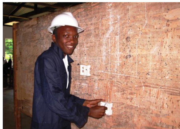
Start in die berufliche Ausbildung