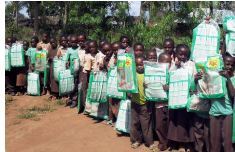
Moskitonetze gegen Malaria

Als Schutz vor Malaria verteilen wir regelmäßig Moskitonetze an die Schulkinder und ihre Familien.